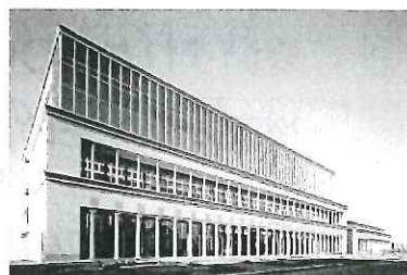
ガトーフェスタハラダ