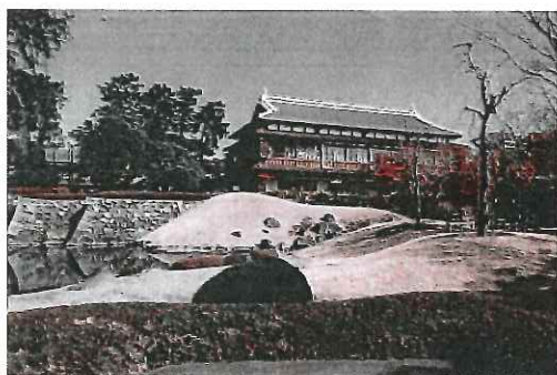
臨江閣（重要文化財）

その後、関東の好きな道の駅人気投票で2009年～2015年まで7年連続1位に選ばれた「ららん藤岡」にてお買物を楽しんでいただいた後は、ラスクで有名な「ガトーフェスタハラダ」の工場見学、試食、お買物など群馬を満喫していただける内容となっています。