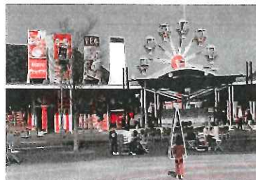
道の駅ららん藤岡