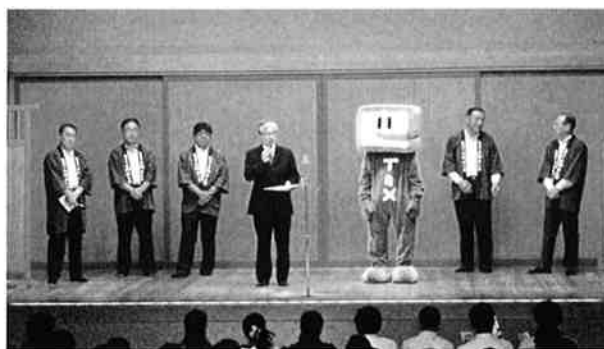
あいさつをする森主署長(中央)・利根川会長(左)

第2部チャリティー寄席は午後5時45分より始まり、奇術や紙切り・落語、三味線漫談・太神楽曲芸などの演芸を午後9時まで楽しんだ。