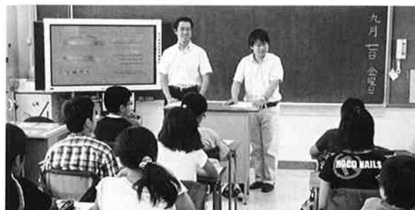
講師を務める埴副部会長（左）と細田幹事