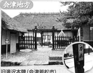
旧滝沢本陣(会津若松市)