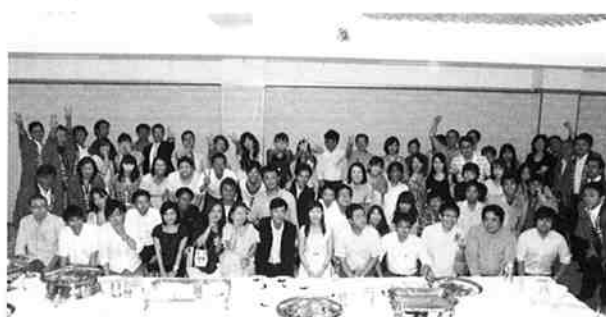
会場での記念撮影