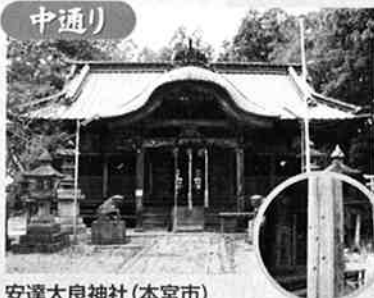
安達太良神社(本宮市)

安達一群の総鎮守。銃撃戦の激しさを物語るかのように、拜殿の柱には弾痕があります。