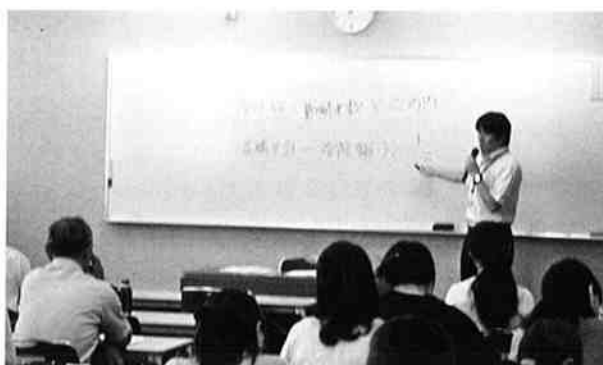
赤川上席調査官が分かり易く解説