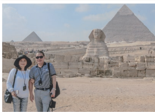
旅好きの奥様と、のんびり海外旅行を楽しむことも。