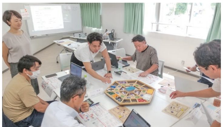
▲カードを引くたびに「経営判断」が求められる

最大化した人が勝ちといった、経営感覚を養うものです。和やかな雰囲気の中、ゲームは進んでいましたが、自社の決算状況が分かると苦笑いする場面も見られました。参加者からは「普段の事業活動とは違う視点から物事を見ることができ、とても有意義だった」などといった声があがっていました。