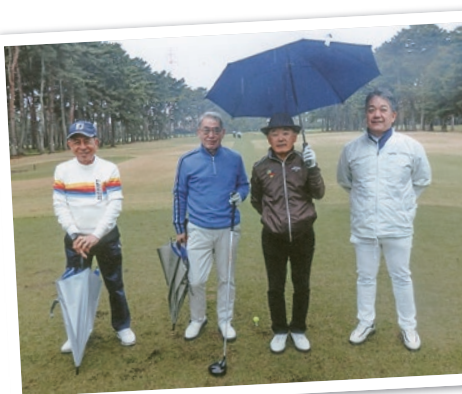
気の置けない仲間とゴルフでリフレッシュ!

〒113-0033 東京都文京区本郷2-16-13 TEL. 03-3813-8841(東京本社) https://www.pulsemotor.com/