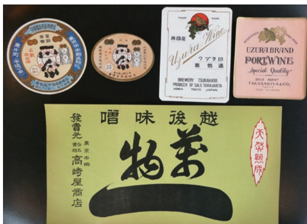
オリジナルブランドとして販売していた酒・味噌のラベル

〒113-0023 東京都文京区向丘1-1-17 TEL. 03-3811-0833(代)