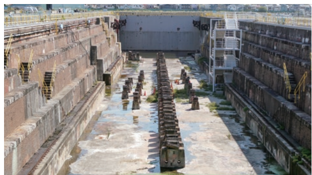
▲産業遺産「浦賀ドック」