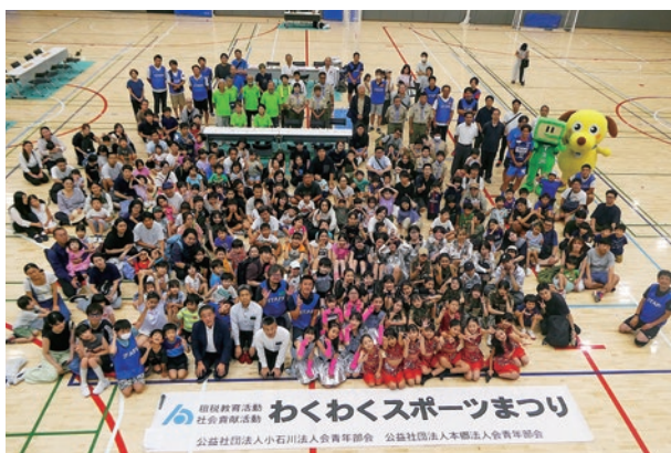
▲たくさんのご参加ありがとうございました

最後になりましたが、今回の開催にご支援・ご協力いただきました関係機関及び協力団体の皆様、誠にありがとうございました。