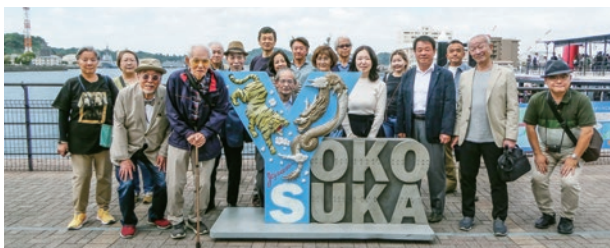
▲横須賀での集合写真

行きと帰りの車中では、税金クイズがみっちり行われ、税知識の習得も十分に図られました。