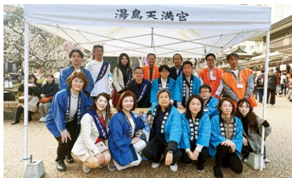
▲本郷税務署、本郷間税会、法人会青年部会・女性部会で実施

また、特設ステージのキャラクターショーでは、国税庁のe-Taxキャラクター「イータ君」も登場。他の人気ゆるキャラとともに、来場者へ向けて税務広報を元気いっぱいアピールしました。