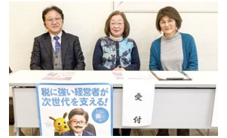
▲ご協力いただきありがとうございました。

のほか、法人会会員、一般の方を含め31名の方にご協力をいただきました。次回は7月28日（火）に実施いたしますので、引き続き多くの方のご協力をお願い申し上げます。