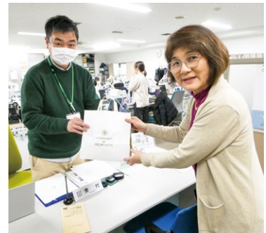
▲使用済み切手を渡しました。