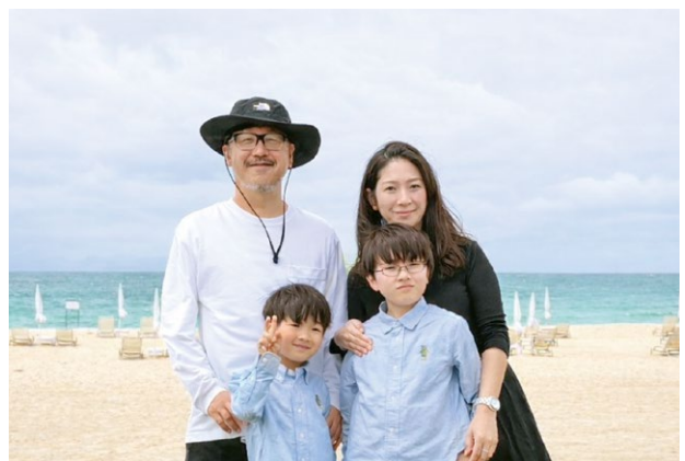
休日は家族と過ごし、心身をリフレッシュ

〒113-0034 東京都文京区湯島3-39-6 TEL. 03-3831-9762(代)