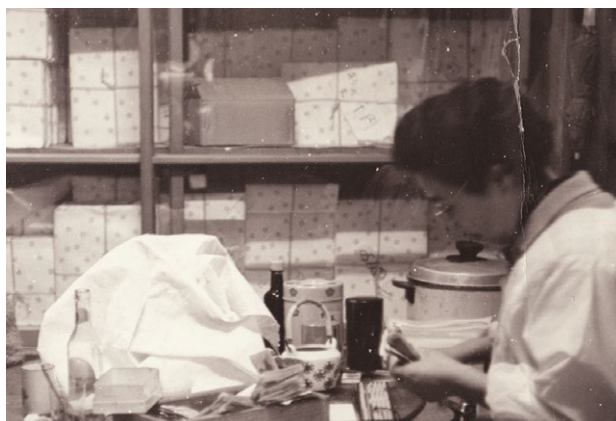
昭和22年、家族を守るために灯した原点

その料亭で、うちのかりんとうを「手土産」として使っていただくようになったことが、大きな転機となりました。粋を知る方々に見出していただいたことで、湯島の路地裏から多くの方々へと、少しずつ名前が広まっていきました。今の「ゆしま花月」があ