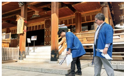
▲青年部会による美化活動