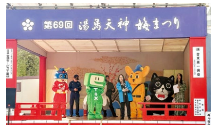
▲国税庁 e-Tax キャラクターのイータ君も登場しました。