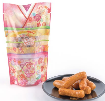
琥珀色のかりんとうと、湯島の情緒を映す着物パッケージ